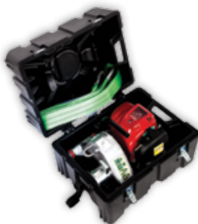
PCA-0102 Spesial bygget transport og oppbevaringskasse for PCW3000 med støpte rom for plass til tilbehør.