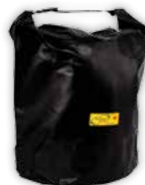
PCA-0105 XXL Extra stor transport bag 50 Liter. Kan monteres på Bæremeisen PCA-0104.