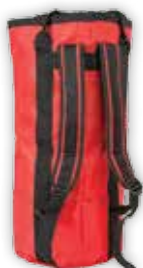
PCA-1256 Medium (m/skulderstropper) Kapasitet: tau 12 mm x 100 m, tau 10 mm x 200 m