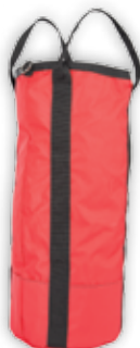
PCA-1257 Stor Kapasitet: tau 12 mm x 150 m