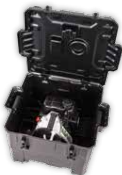
PCA-0100 Spesial bygget transport og oppbevaringskasse for PCW5000 med støpte rom for mange tilbehør.