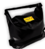
PCA-0103 Vinyl - for bæremeis PCA-0104 Kapasitet: tau 10 mm x 50 m