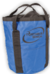
PCA-1255 Liten Kapasitet: tau 12 mm x 50 m, tau 10 mm x 100 m

Disee taubaggene tar vare på tauet og tilbehør på en enkel og lettvinnt måte. Oppbevar tauet ved å dytte det ned i sekken, og du har aldri problemer med orden på tauet.