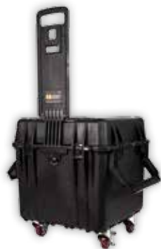
PCA-0340 Wanntett og luft tett kasse med innredning som kan tilpasses maskin og tilbehør.

Uansett hvor du ønsker å ta med deg din vinsj, vil det være lettes og tryggest å frakte den i en av våre transportløsninger. Du kan til og med bære PCW3000 i en bæremeis som passer til kassen.