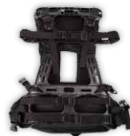
PCA-0104 Bæremeis for transportkassen PCA-0102 og den extra store transport sekken XXL PCA-0105.