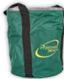
PCA-1257XL X-Stor Kapasitet: tau 12 mm x 200 m